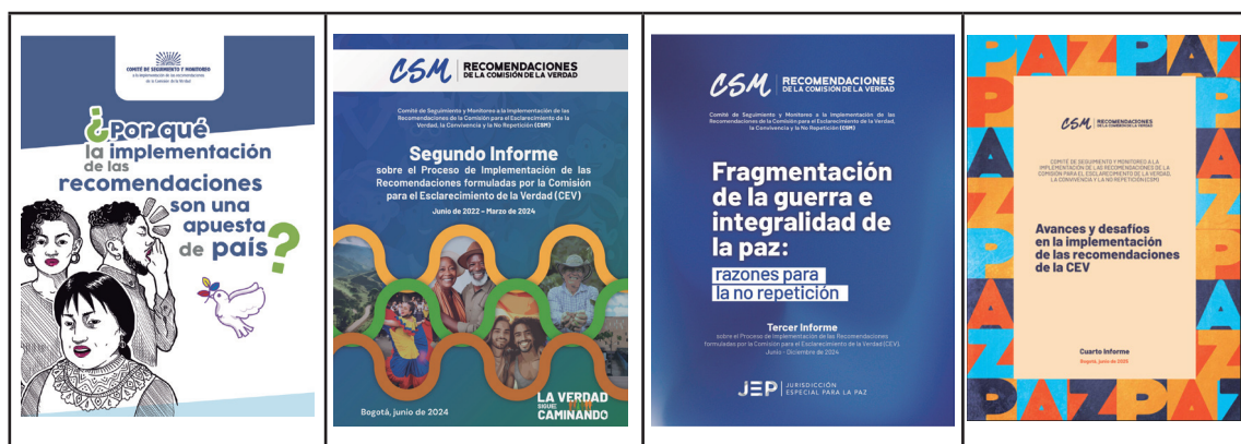
Figura 2A. Informes entregados por el Comité de Seguimiento y Monitoreo al país en el ejercicio de su mandato

El II y el IV Informe de seguimiento y monitoreo, publicados en junio de 2024 y julio de 2025, respectivamente, realizaron un seguimiento general a las recomendaciones. Se estructuraron a partir de las nueve líneas temáticas definidas por la CEV en su capítulo de hallazgos y recomendaciones y analizaron la implementación del universo de las 220 recomendaciones. El segundo informe evidenció los avances en la implementación de las recomendaciones entre 2022 y 2024. El cuarto informe analizó los avances desde 2024 hasta 2025.