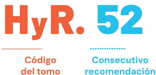
Figura 1A. Estructura de la codificación de las recomendaciones

Con el fin de clasificar y diferenciar cada una de las 220 recomendaciones, a cada recomendación se le asignó un código compuesto por la abreviatura correspondiente al tomo y un número consecutivo que permite identificarla dentro de su respectivo tomo.